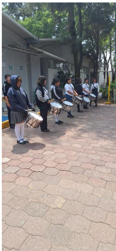
Banda de guerra